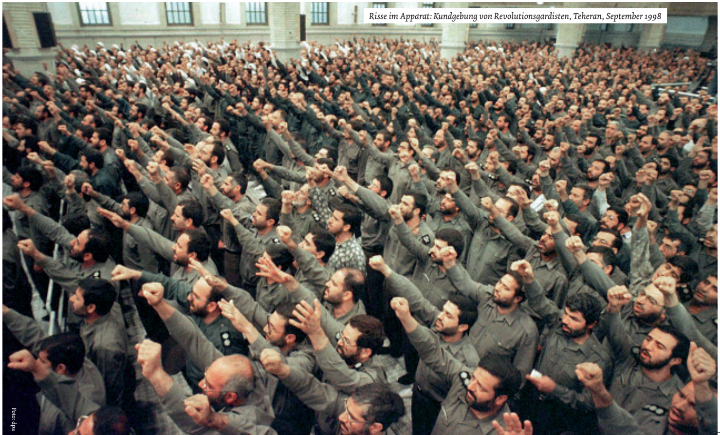
Risse im Apparat: Kundgebung von Revolutionsgardisten, Teheran, September 1998